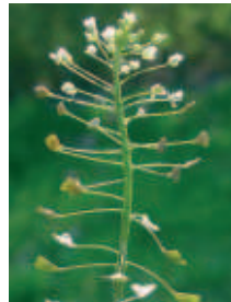
Capsela bursa pastoris