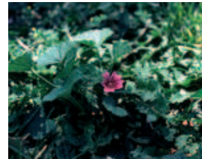
Malva sp (Malva)